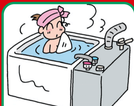
屋内式ガスふろがま (都市ガス用/プロパンガス用)