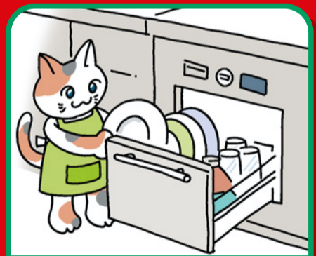
ビルトイン式電気食器洗機