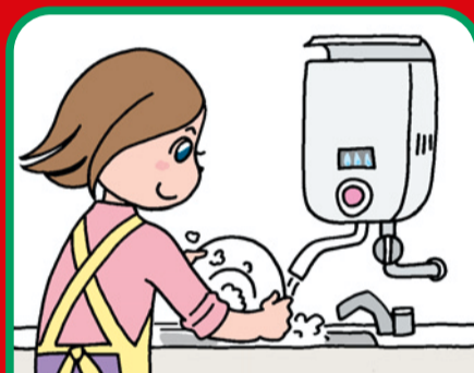
屋内式ガス瞬間湯沸器 (都市ガス用/プロパンガス用)