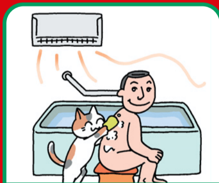
浴室用電気乾燥機

現在お使いの製品*も 点検可能ですので、 詳しくはメーカーなどに お尋ねください。